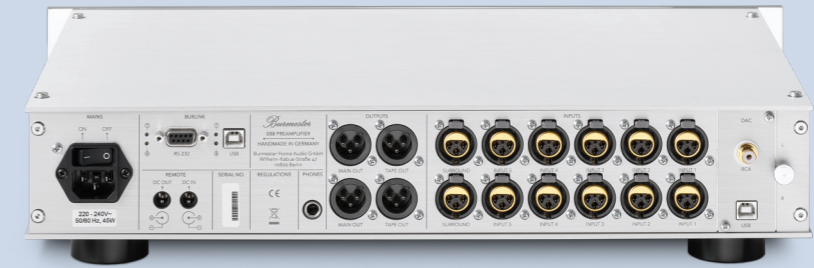
088 TOP LINE